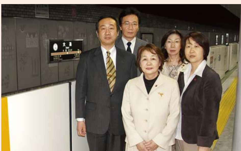
▶可動柵を視察する市議員

地交付金は「本来の固定資産税相当額より1億円以上少ない」と指摘し、正当額を政府に求めていくよう迫りました。 また、黒字の大手企業が払う法人市民税の超過課税は、「道内の35市中32市は14.7%。札幌市は、14.5%と低い。他市並みの税を負担してもらい、財源を確保すべきだ」と、求めました。