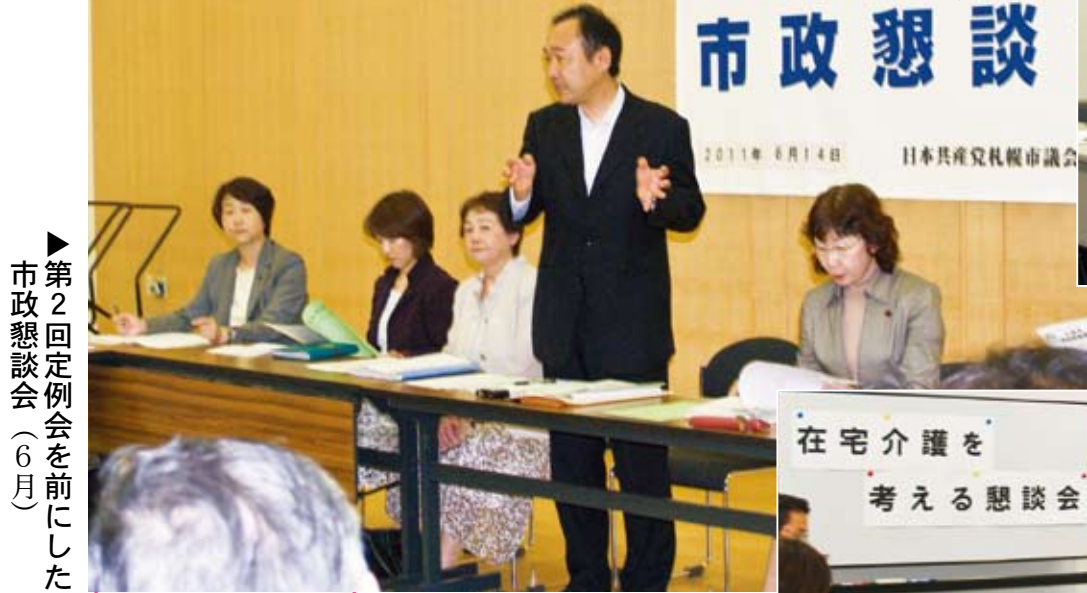
▶第2回定例会を前にした市政懇談会（6月）