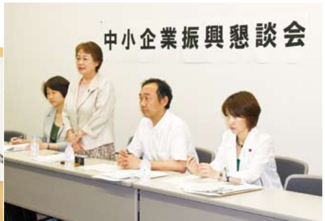
▶業者のみなさんとの懇談会（7月）