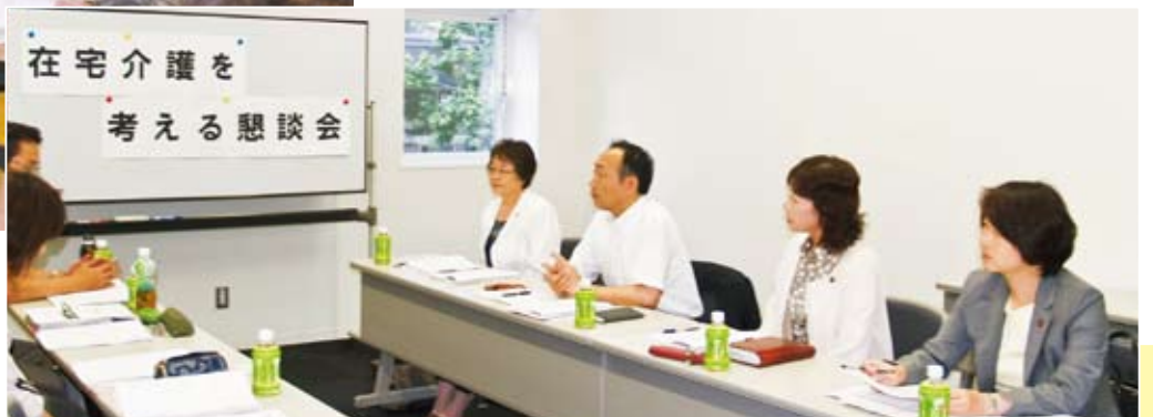
▼介護事業に携わるみなさんとの懇談会（7月）