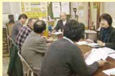
中小業者のみなさんと懇談

共産党市議団は、2011年度予算について市長に165項目の要望を行いました。国保料下げや市営住宅の住み替え、修繕などについても要望、保育所の待機児童解消についても「前倒しで可能」との見解を市長が明らかにし、住宅リフォーム条