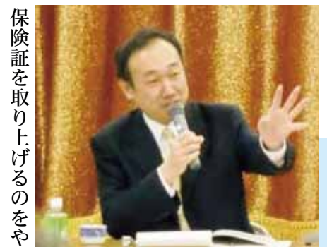
政府交渉の結果を報告