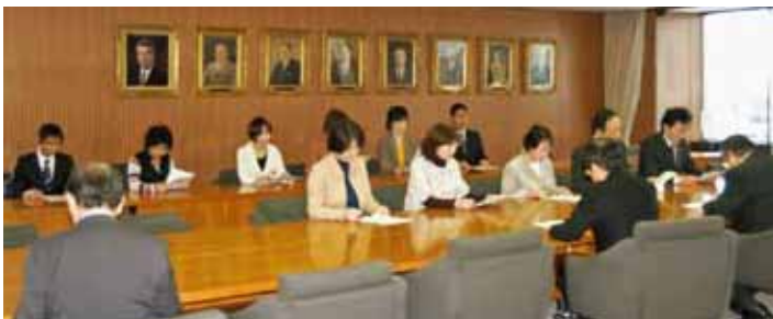
市長へ予算要望行う党市議など (12月15日)

日本共産党札幌市議団は、上田文雄札幌市長に対して2011年度予算編成に関して、165項目の要望を行いました。財源を示し、国保料1万円引き下げ、特別養護老人ホームの定員600人増、保育所千人以上増、若年層の正規雇用促進、市営住宅の計画的住み替え促進、就学援助の基準額引き上げ、30人学級実施、事業仕分け、生活道の除排雪強化などを求めました。