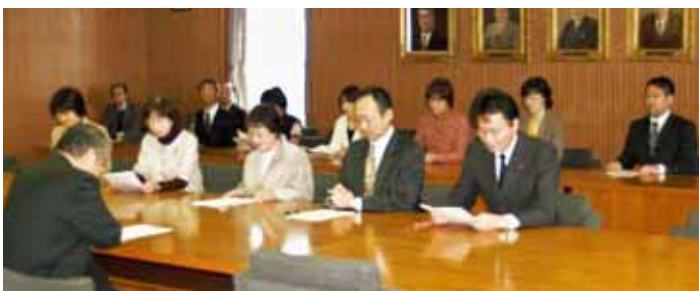
市長へ予算要望行う党市議など (12月15日)

日本共産党札幌市議団は、上田文雄札幌市長に対して2011年度予算編成に関して、165項目の要望を行いました。財源を示し、国保料1万円引き下げ、特別養護老人ホームの定員600人増、保育所千人以上増、若年層の正規雇用促進、市営住宅の計画的住み替え促進、就学援助の基準額引き上げ、30人学級実施、事業仕分け、生活道の除排雪強化などを求めました。