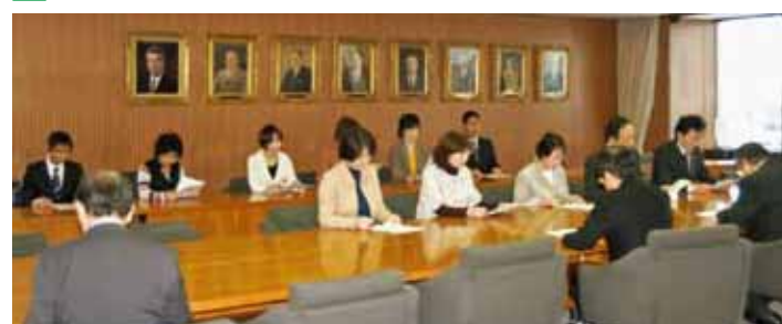
市長へ予算要望行う党市議など (12月15日)

日本共産党札幌市議団は、上田文雄札幌市長に対して2011年度予算編成に関して、165項目の要望を行いました。財源を示し、国保料1万円引き下げ、特別養護老人ホームの定員600人増、保育所千人以上増、若年層の正規雇用促進、市営住宅の計画的住み替え促進、就学援助の基準額引き上げ、30人学級実施、事業仕分け、生活道の除排雪強化などを求めました。