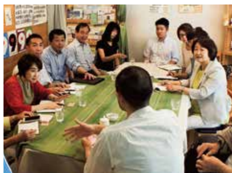
子ども食堂のスタッフ(手前)と懇談

「子ども食堂」のスタッフと懇談。「子ども達といっしょに作物を育て、収穫、調理して食育を伝えたい」と話していました。