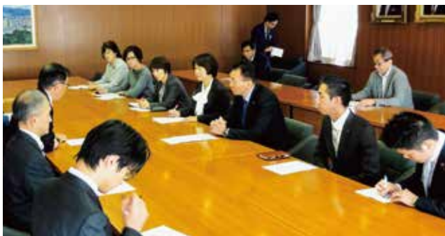
アスベスト問題で対策強化を申し入れる

給食の再開に万全をつくすとともに、飛散したアスベストの調査と正確な情報提供、迅速な除去を求めました。