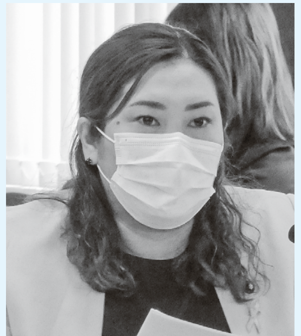
日本共産党札幌市議会議員

日本共産党は、医療と検査の体制を抜本的に強化し、市民の命とくらし、中小事業者の経営を守るために全力をつくします。