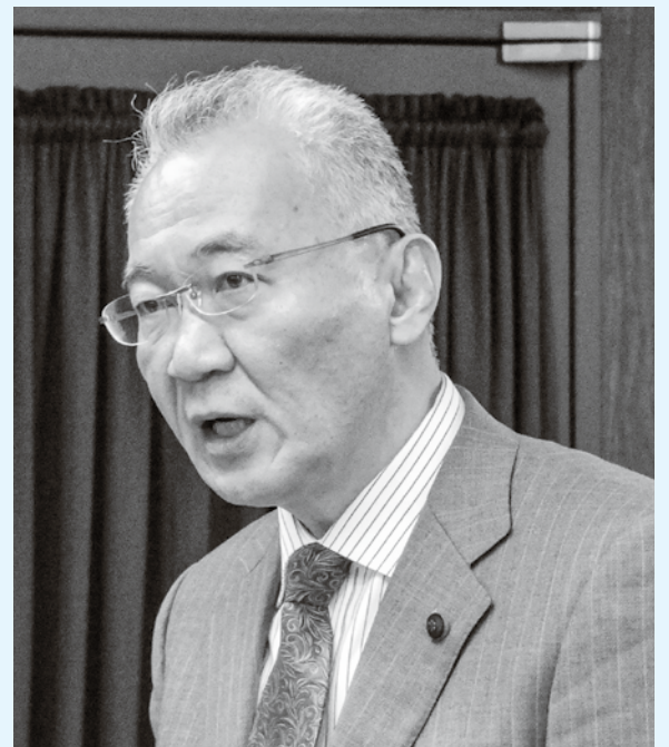
日本共産党札幌市議会議員

日本共産党は、医療と検査の体制を抜本的に強化し、市民の 命とくらし、中小事業者の経営を守るために全力をつくします。