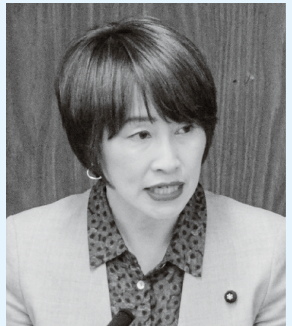
日本共産党札幌市議会議員

日本共産党は、医療と検査の体制を抜本的に強化し、市民の命とくらし、中小事業者の経営を守るために全力をつくします。