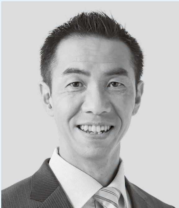
日本共産党札幌市議会議員