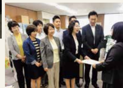
保育団体から提出された陳情 について要請を受ける