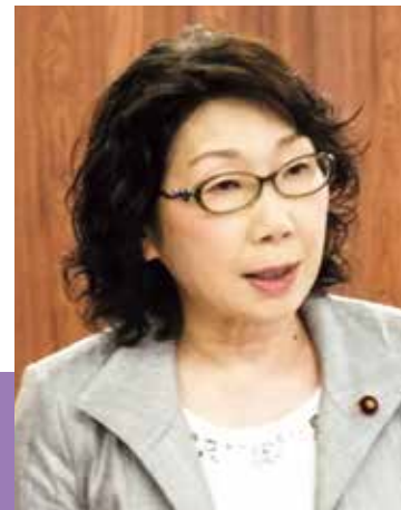
坂本きょう子 議員