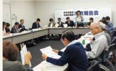
参加者と懇談する党市議団

懇談では「営利企業の参入や無資格でも可能など、新制度で保育の質の低下が心配」「精神障がい者の運賃割引を地下鉄、市電で先行実施を」「非正規が全国で4割と貧困化が…。厳しい冬を越す燃料手当を」など、切実な要望がだされました。