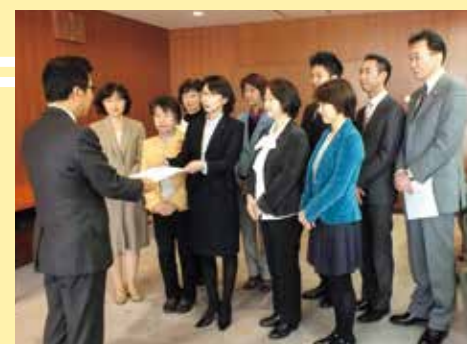
秋元市長に要望書を手渡す