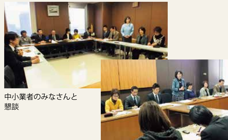
中小業者のみなさんと懇談

中小業者や医療団体などと懇談し、切実な要望を聞き、その実現のために力を合わせています。